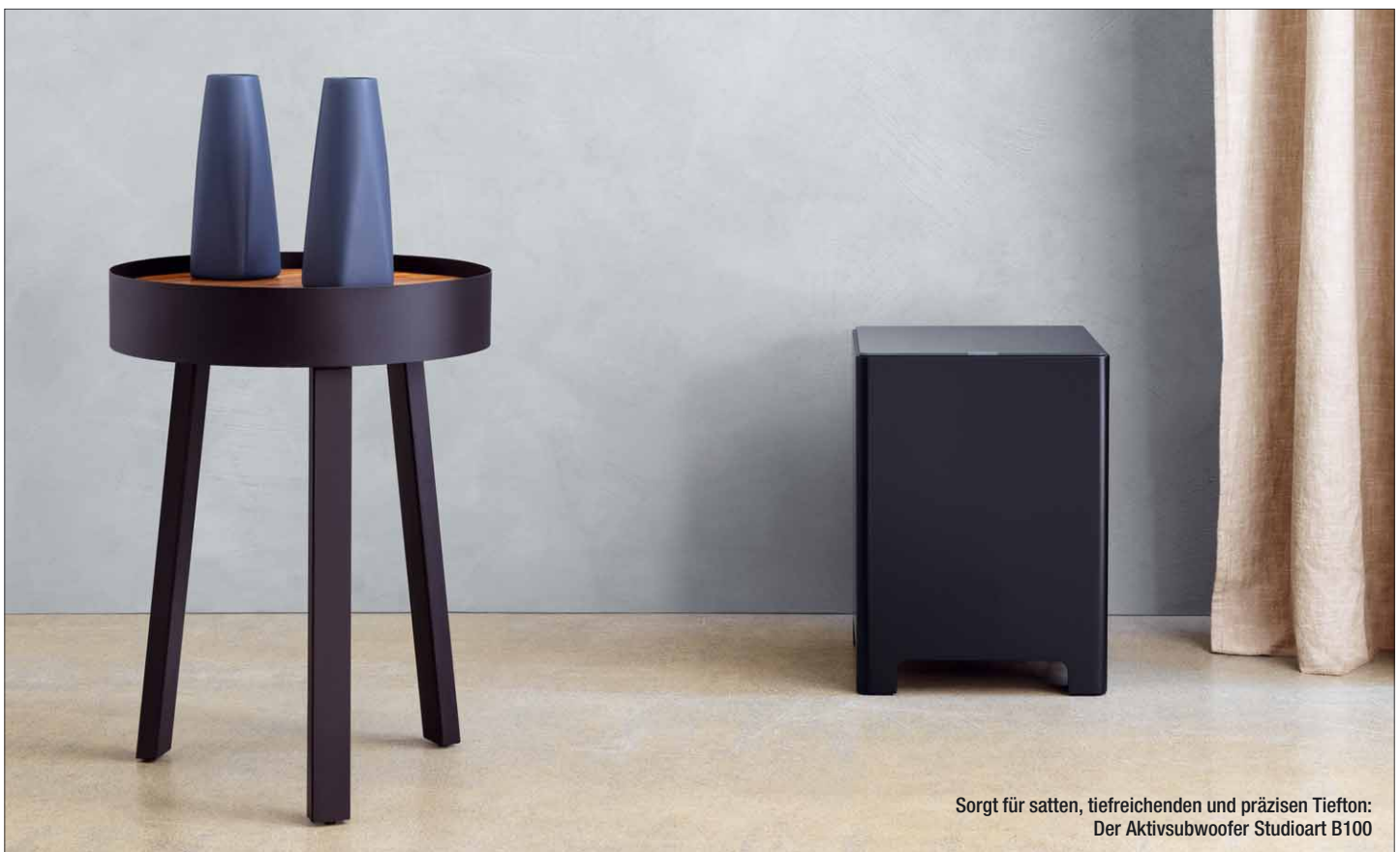
Sorgt für satten, tiefreichenden und präzisen Tiefton: Der Aktivsubwoofer Studioart B100