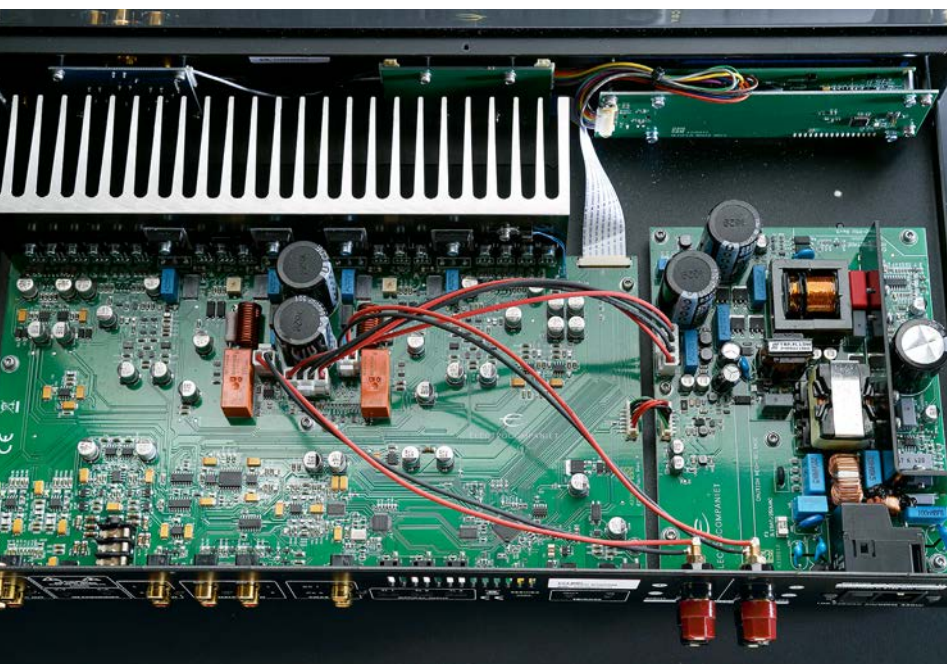
Sauber und aufgeräumt zeigt sich der ECI 80D. Das Netzteil sitzt auf einer eigenen Platine (re.)

Bleibt als Fazit, dass der Proband alle in ihn gestellten Erwartungen erfüllte, sehr vielseitig und flexibel, dabei leicht bedienbar und fast überall unterzubringen ist. Das Preis-Leistungs-Verhältnis ist trotz „Made in Norway“ hervorragend. ■