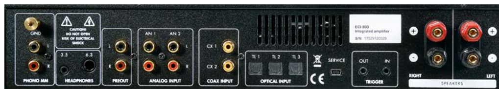
Sinnvolle Anschlussmöglichkeiten, bei den Buchsen zeigt sich der Rotstift.

Saxofon, nur dezent von Bass und Schlagzeug begleitet. Musikalisch wie klanglich ein feines und auch für Nicht-Jazzler verträgliches Album.